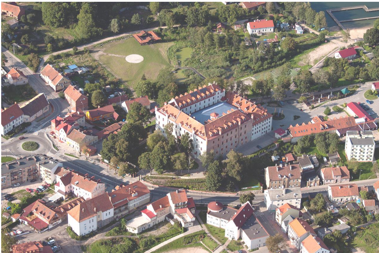
Panorama części Rynu – zdjęcie z 2010r.

Dzisiaj Ryn jest jednym z mniejszych miasteczek w województwie warmińsko-mazurskim. Liczy 3098 mieszkańców. W sezonie letnim liczba mieszkańców podwaja się dzięki przyjeżdżającym turystom.