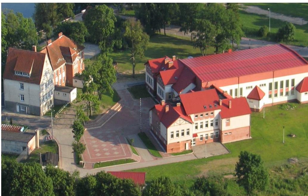
Zespół Szkolno – Przedszkolny w Rynie

Warunki nauczania oceniane są jako dobre. Budynki szkolne położone są blisko siebie.