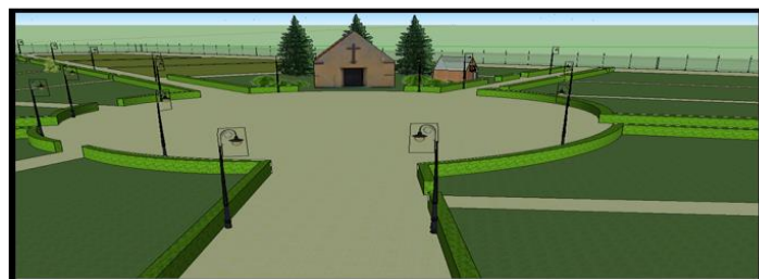
Koncepcja planu cmentarza (wg P.Żmijewskiej)