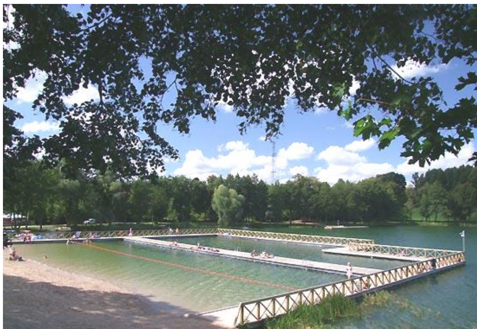
zdjęcie plaży nad Jez. Olów