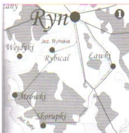
Plan Rozwoju Miejscowości RYBICAL

Przez wieś biegnie również szlak rowerowy: RYN - RYBICAL - MRÓWKI - SKORUPKI - ŁAWKI - RYN (24 km). W najbliższym czasie ma zostać odnowiony kolejny szlak rowerowy łączący Rybical z Mikołajkami.