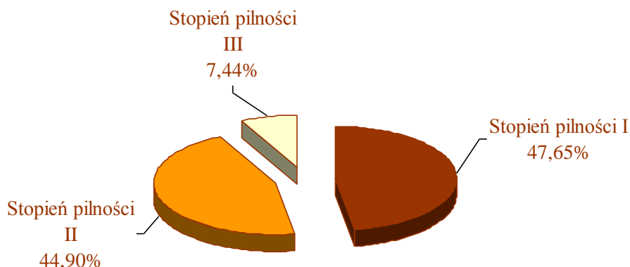
Rysunek 5. Procentowy podział wyrobów zawierających azbest znajdujących się w zabudowie mieszkaniowej i budynkach gospodarczych ze względu na stopień pilności działań naprawczych