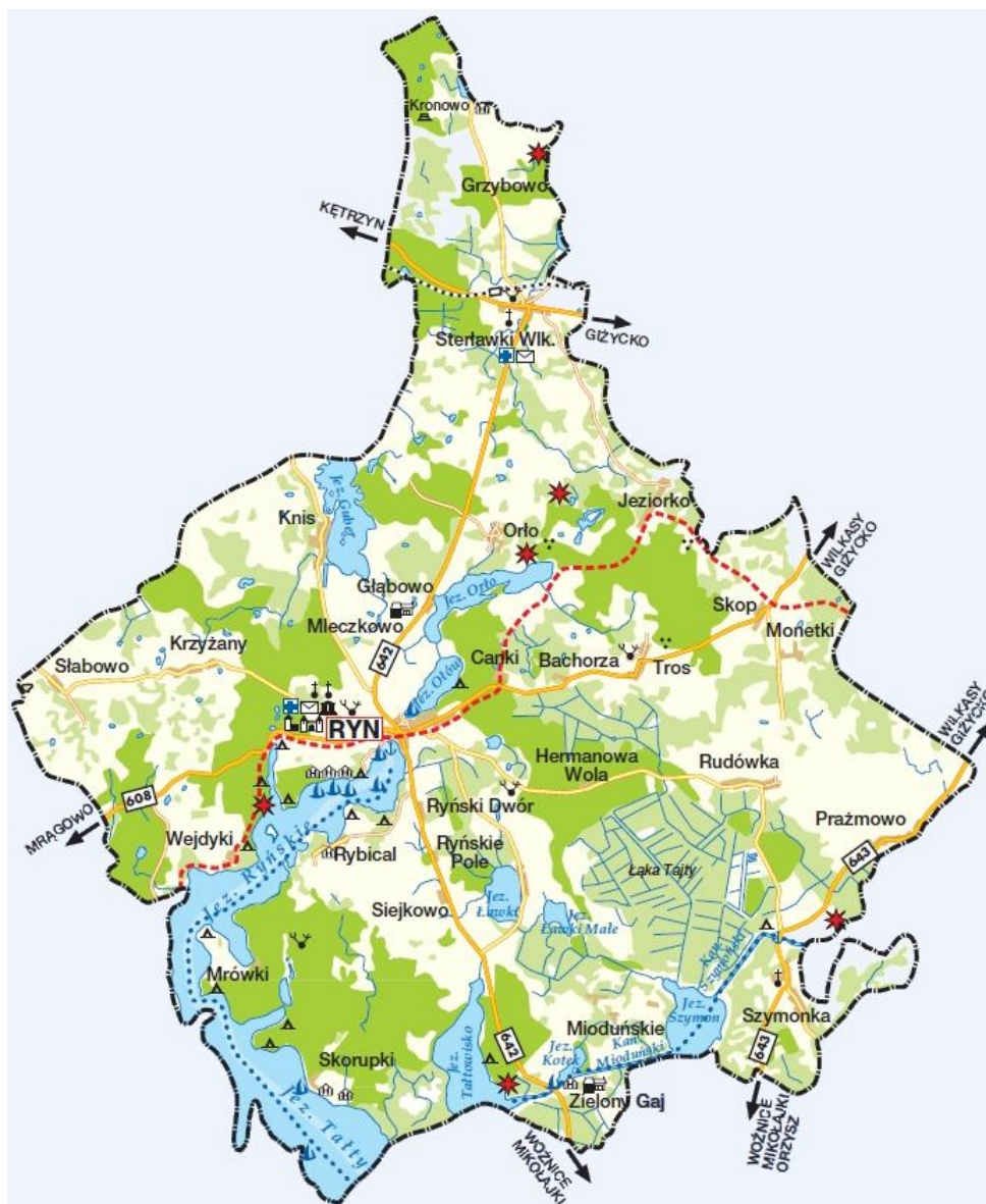
Rysunek 3. Mapa Gminy Ryn