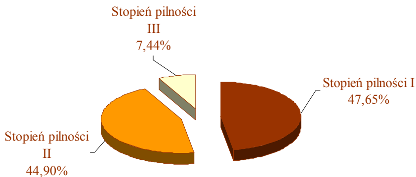
Rysunek 5. Procentowy podział wyrobów zawierających azbest znajdujących się w zabudowie mieszkaniowej i budynkach gospodarczych ze względu na stopień pilności działań naprawczych

Na rys. 5 przedstawiono procentowy udział wyrobów azbestowych zaklasyfikowanych do I, II i III stopnia pilności w stosunku do ogólnej ilości omawianych wyrobów na terenie gminy.