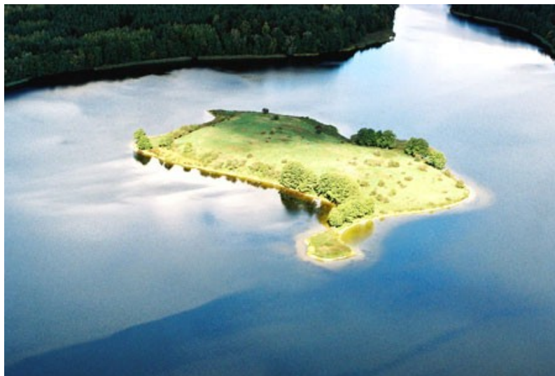
Wyspa Łysa-Duża-Ptasia, zatoka Rominek oraz wielki las